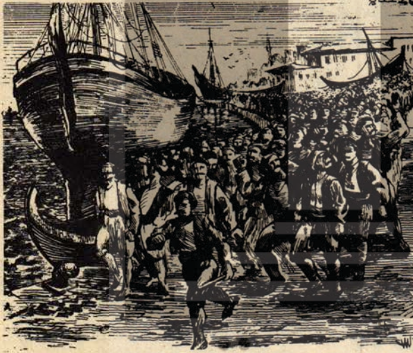
İLK GREV: 1872 de Tersanede

1871 de kurulan "AMELE PERVER CEMİYETİ" ilk işçi örgütü olarak bilinir. Örgüt bir yardım sevenler derneği niteliğindedir. Cemiyet, burjuvazi ve