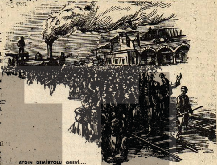
AYDIN DEMİRYOLU GREVİ...

Grev yasağı kanununa rağmen işçi sınıfı hareketleri durmadı. 1909 dan 1914 e (1. Dünya Savaşı'nın başlangıcı) kadar Selanik İstanbul ve İzmirde devam etmiştir. Kanuna rağmen süren bu hareketler, sert, kararlı ve işyeri grevlerinden ziyade, işkolu seviyesinde grevlerinden olduklarından 5-10 bin kişilik hareketler biçiminde geliyordu.